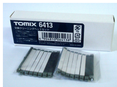
Tomix 6413: Ersatzspads / Replacement pads

Alle Bilder © Tomytec & JapanModelRailways, Nachdruck und Wiedergabe nur mit Genehmigung all pictures © Tomytec & JapanModelRailways, reprint and use with permission only